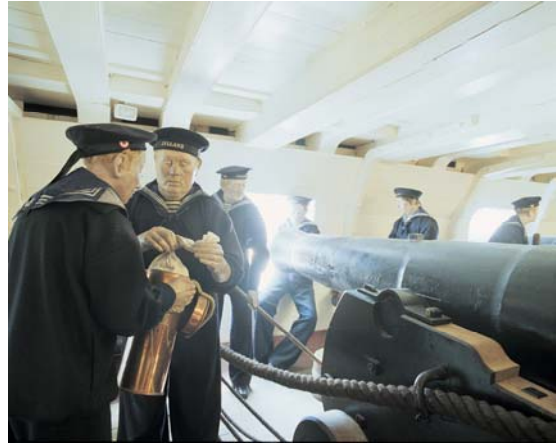
Besøg Fregatten Jylland i årsmødebyen Ebeltoft.